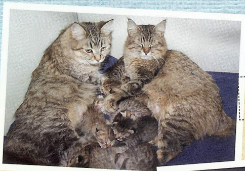
貓媽媽們會一起照顧小貓。