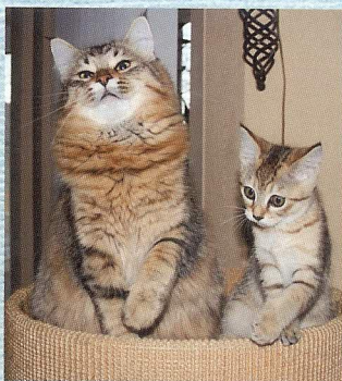
貓舍的貓兒都愛與主理人說話。