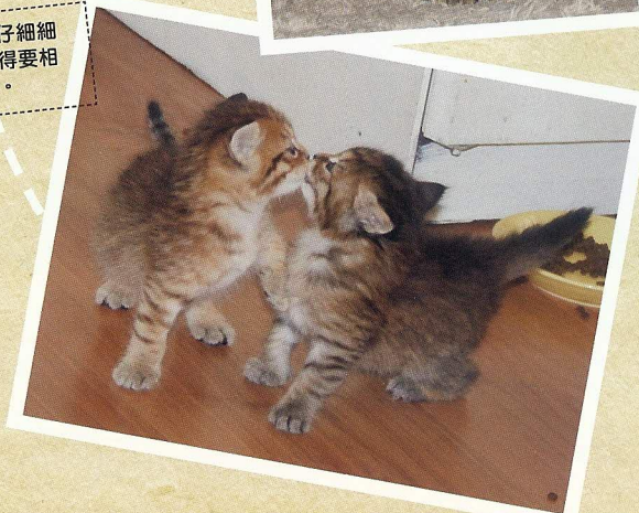
牠們貓仔細細已經懂得要相親相愛。