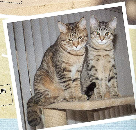
又圓又大的臉是牠們可愛的特徵之一。