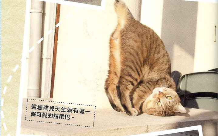
這種貓兒天生就有著一條可愛的短尾巴。